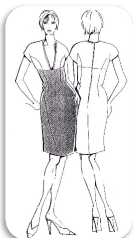
キモノ袖エンパイアカットOP